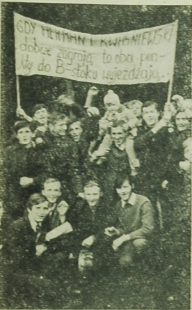
W taki sposób grupa kibiców Włokniarza oddawała otuchy swojej drużynie podczas meczu Szkoła - Włokniarz w Czarnym Białostoku. Oby tak częściej!