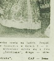
Na raz wylądował w Białymstoku w dniu 22 grudnia 1968 r. w godzinach 18:00-19:00, przedwojennym widowiskiem z 1942 r. w Białymstoku. W dniu 22 grudnia 1968 r. w godzinach 18:00-19:00, przedwojennym widowiskiem z 1942 r. w Białymstoku.

W UBIEGIM SĄDZIM NIESEM Prace Kalendarza W ubiegłym sądzie nieSEM Prace Kalendarza W ubiegłym sądzie nieSEM Prace Kalendarza