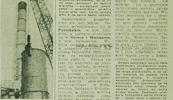
W Kółkach na Kł... W Kółkach na Kł...