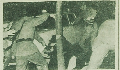
Na całym świecie trwała protesty niezłomych wyrobów wydzianem przybiegła żucie walczą za A. Pasquillia, oskarżonego o walkowanie do kłosała zamachu na premiera Jozefa. NA ZDJĘCIU: brutalna akcja policji włoskiej w czasie demonstracji w Rzymie.