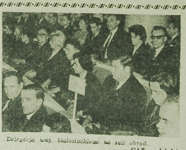
Delegacja woj. białostockiego na sali obrad. CAE. — telefoto