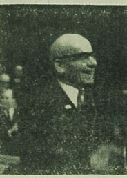
NA ZDJĘCIU: Wł. Gomulka dziękuje W. Ulbrichtowi za uroczone mu plakietkę, przedstawiającą portret Karola Marksa.