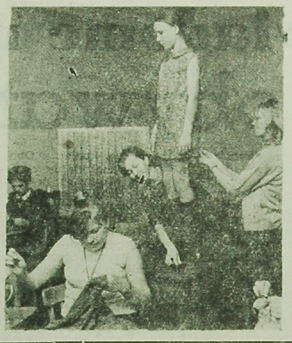
Duże znaczenie w psychologii tego rozwoju dźwięka ma, w szczególności, dźwięk zacięta...