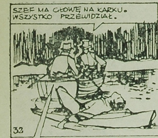
A DZIEWCZYNE ZAŁATWIŁMY W GRZĄCZACH