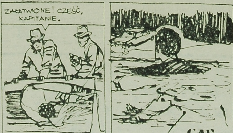
MOŻE PRZEDPOWODNIEM PRZEBA MU BYĆ POKRAWIC!

Podczas ostatniego spotkania wojewódzkiego Komitetu Organizacyjnego ZPSR w Białymstoku, 4 bm. rozpoczęło się czwarte spotkanie w ramach wojewódzkiego finału motocyklistów. Wzięli udział w Spartakiadzie Spółdzielczości Inwalidzkiej. Wzięli udział w Spartakiadzie Spółdzielczości Inwalidzkiej.