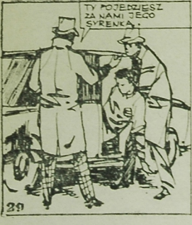
TY POTRZEBSZ ZA NAMI JEGO SYRENKA.