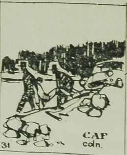
ROMUSA, ZE SIĘ WIAŁ.