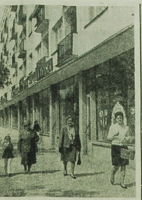
HAINÓWKA rozbudowuje się coraz bardziej. NA ZDJECIU: fragment nowych domów mieszkalnych przy ul. I. Majna.