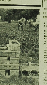
Kończy się zbiór truskawek.

W ubiegłym roku, gdy również dawał się odczuć w mieście brak wody, Wydział Inżynierii Komunalnej wydał zalecenie podjęcia wszystkich możliwych kroków i wykorzystania źródeł w mieście, nadających się do pobierania wody, aby poprawić istniejącą sytuację. Dzieki temu wykorzystano jedną studnię głębinową, włączając ją do miejskiej sieci wodociągowej. Poprawiło to zaopatrzenie w wodę najbliższej dzielnicy.