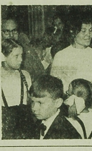
Francja w dniu wielkiej próby