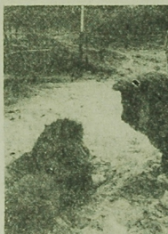
W Wilnie otwarto — drugi dzień otwartej siatki, która okazała się nieudaną po dowiedzeniu w Amineem, gdzie lew zranił łuskiego turystę. CAP — ANP

NOWE MIASTA Na północnym wybrzeżu Islandii powstało nowe miasteczko. W tym czasie ona utrzymuje listy korespondencyjne z zagranicą. W tym czasie ona utrzymuje listy korespondencyjne z zagranicą.