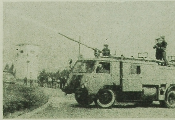
Pokazowe gaszenie pożaru przy pomocy nowoczesnego sprzętu. Specjalne działo wyrzuca silny strumień pary.

Strażacy monieccy znają z własności nie tylko wyciągnięcie i swietlice, zbiorniki ognioodporne, drąg itp. Starsi, doświadczeni już strażacy, przekazują swoje umiejętności młodszym. Powstają młodzieżowe drużyny strażackie, w tym także żeńskie. Do najaktywniejszych należą jednostki OSP w Krzywiniu, Goniatku, Monkach, Ponińskich, Brzolanach, Brzozowej, Gorze i Długoleczu. (zw)