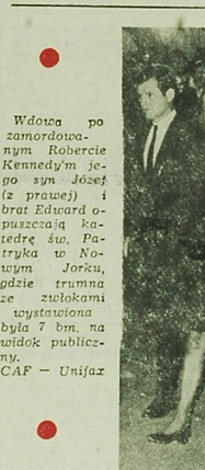
Wzornia po zamordowaniu Roberta Kennedy'ego — w tym Edward o - puszczenia katedry św. Patryka w Nowym Jorku, gdzie trumna ze zwłokami senatora została wystawiona była 7 bm, na widok publiczny. CAP — Unifaz

WARSZAWA (PAP) — Kolejne piąte posiedzenie Sejmu odbyło się wprawdopodobnie pod koniec bieżącego miesiąca, 8 bm. Na porządku obrad znajdą się zapewne polityki w sprawie „sily zbrojowej w slobie ojczyzny” oraz o pracownikach rad narodowych.