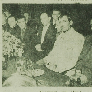
Fragment sali obrad.

Wskazywanie na scenie sali wybrorczych w grupach i oddziałowych organizacjach partyjnych oraz nowych poroek, jakie zaszły w ostatnich miesiącach w szeregach partyjnych zakładu.