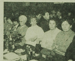
Zarząd Ogrędu Związku Zawodowego Młynarskiego.

Wskazywanie na scenie sali wybrorczych w grupach i oddziałowych organizacjach partyjnych oraz nowych poroek, jakie zaszły w ostatnich miesiącach w szeregach partyjnych zakładu.