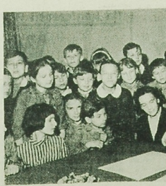
W Dniach Obławy, Książki i Prasy redakcja nasza odwiedziła wielu czytelników. Najmilszymi gośćmi była młodzież, która bardzo żywo interesowała się pracą redakcji. W Dniach Obławy, Książki i Prasy redakcja nasza odwiedziła wielu czytelników.

Rejon Energetyczny Augustów zawiadawia odbiorców zamieszkałych we wsiach Rakci, Male, Ludwinowo, Wasilówka, Kowasy, Wierchochy, Szczodrzyki, Bolesły, Nieszki, Rybnie, Nieszki-Nowé Dwór, Kotowina, Urbanki, Konopki, Gębalkowa, Karasewo, Sadownia, Nowa Wieś i I i II powiatu Suwalski, że od dnia 23.VI.68 r. nastąpią przerwy w dostawie energii elektrycznej. Przerwa w dopływie prądu.