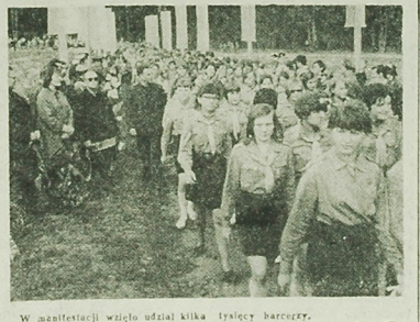
W manifestacji wzięło udział kilka tysięcy harcerzy.