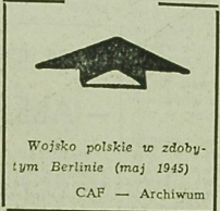
Wojsko polskie w zdobytym Berlinie (maj 1945)