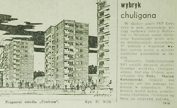
Fragment osiedla „Centrum”. Rys. H. Wilk

Ażkołwiek dyrekcja zjednoczenia i kierownictwa przedsiębiorstw w pracy w przyszłości i chociaż realizacja planów sprzyja czyn zjazdowy, to niemiernie będzie zadania nie są łatwe. Nie tylko ze względu na swą wielkość. Przede wszystkim z powodu nie przewidywalnych jeszcze do końca zimowych warunków powodujących przestoje. Na przykład nie zawsze są na czas potrzebne materiały, co przy stałej ilości