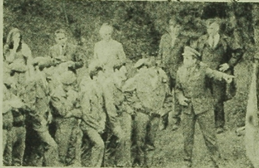
Przygotowanie do pojedynku strażniczego.

Niedziela rozpoczęła się w pow. białostockim masowym czynnym społecznym od wczesnych godzin rannych. Mieszkańcy gromad: Szynki, Juszkowski Gród i Jabłowa pracowali przy budowie i naprawach dróg, przepławów, urządzali strażnice. Realizowali długofalowe zobowiązania, podjęte dla uczczenia 25-lecia Ludowego Wojska Polskiego i V Zjazdu partii.