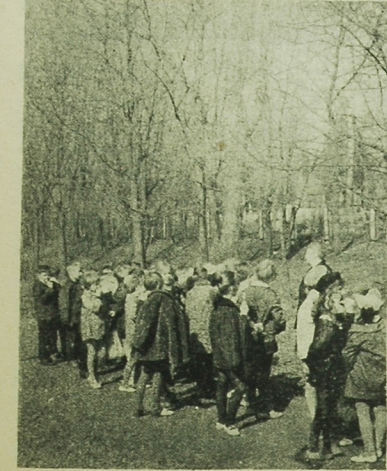
Na spacerze w Zwieterzycy.