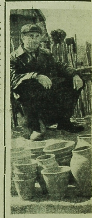
Na targu w Sienach, tak jak i w wielu innych miastach, mieszkańcy kupującej jest coraz więcej.

Jak na wybrane gromadziej konferencji wybrano tam nowym kierownikiem Gromadki PZPR, sekretarzem Zaręba, został wybrany miejscowy aktor. Jednocześnie zebrani po wysłuchaniu wykładni dotyczącej ostatniej akcji, w której na naszą partię uchwalili rezolucję potępiającą wrople partii ekscywy. (K)