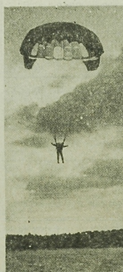
Pol. Z. Kozłowiec