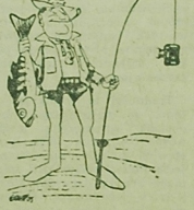
„Książki” — 192 głosów.