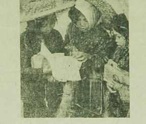
Żył i grube kapeluszki ze słony chromu małe naczynia przed podnoskami — Pod się gruba amerykańskich pałków dzieci wielomaciek uczęszczają regularnie do szkoły.