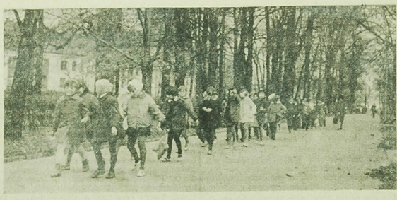
Wiosenna wyćwiczenia do parku.