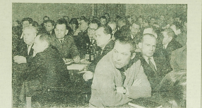
Na naszym zdjęciu: widok sali obrad