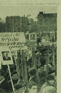
Wielka manifestacja w Warszawie, 22. III. 1968 r.

MEKSYK (PAP) — Jak donoszą z Gwatemali, w środę odnaleziono tam porwanego przez nieznaną sprawców ub. tygodniu arcybiskupa Mario Casariego. Dostrójnik odnaleziony został wraz ze swoim szoferem w mieście Quezal Temango 200 km od stolicy kraju.