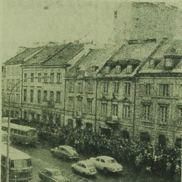
Wiele studentki a później ekscyja na Krakowskim Przedmieściu przyciągały tłum warszawian obserwujących zajęcia. CAP