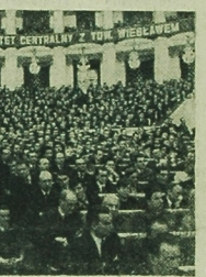
Cląg dalszy na str. 2