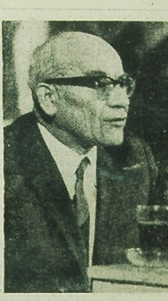
I sekretarz KC PZPR — Władysław Gomułka

Specjalne oświadczenie rządu cypryjskiego stwierdza, że decyzja o uniemożliwieniu poprzedzającego wydarzenia została podjęta, aby przyczynić się do poprawienia sytuacji i umożliwienia rozmów między obu wspólnotami wyspy.