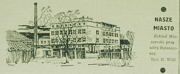
Widok na zakład przy ulicy Botanicznej w Białymstoku. Rysunek H. Wilka.

Dziś, o godz. 19 w Klubie Młoczek odbędzie się odzyskanie Współczesnej religii swiatki. który wygłoszeli lek. K. PZPR — dr Henryk Chajda. (CH)