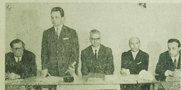
Porozumienie między ZW ZMS a oddziałem CZSMB