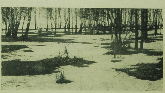
Przedwiośnie.