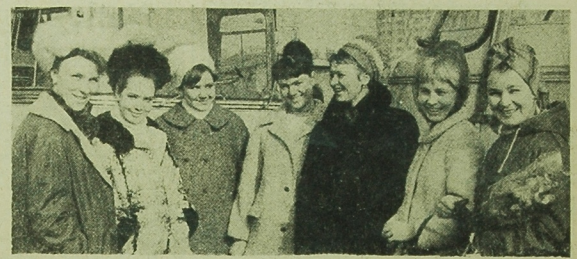
Do Warszawy przyjechał 7 bm. zespół artystów z ankietami do Główna, w dniach od 27 do 31 i kwietnia. NA ZJEDNOCZENIE radzieckie artystki w Dworcu Głównym w Warszawie.