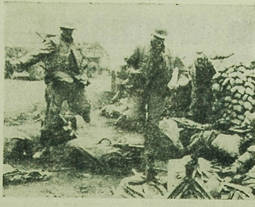
Sily wyzwolonea oblestaniasta ostrzeliwaja bazy „marines” w Khe Sanh nastajac jeq umocnienia. Baza obozrona jest ostrzelana pierdzeniem od-dzialow wyzwolecia samolotowjajacej Amerykanom dostawia je ob-rotow. NA ZDJECIU: marines szukajq osiojy przed ogniem przyznanektoz mo-dzicy i rakiet.

MOSKWA (PAP) — Komitet Centralny KPZR, Prezydium Rady Najwyższej ZSRR i Rada Ministrów ZSRR wydały w sobotę przyjęcie w kremleńskim Pałacu Zjazdów na cześć 50-lecia sił zbrojnych ZSRR. Obecni byli członkowie i zastępcy członków Biura Politycznego KC KPZR, sekretarze KC KPZR, wybitni radzieccy dowódcy i marszałkowie Związku Radzieckiego, generałowie i admirałowie, weterani wojny domowej i Wielkiej Wojny Narodowej.