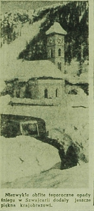
Niewzlike obfite teogoroczne opady niega w Szawarzi dodajq jeszcze pietka krapelozwi.