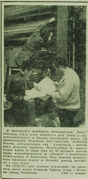
W Blatolście kombinacie włókienniczym „Fasty” dotychczas kłosa prac montażowe przy jednej z najważniejszych linii produkcyjnych. W tle widać stalowe elementy tej kombinatu. W pierwszym planie pracownicy linii produkcyjnej. Wykonawcą i metodą pracy będzie w ciągu roku do 90 milionów metrów tkaniny wyprodukowanych w „Fasty” i kombinacie włókienniczym w Zambrowie. Przy montażu urządzeń, które zakupione zostały w Holandii, pracują specjaliści z tego kraju.

NA ZDJĘCIU: Blatolscy wrzesca odznaczanie ministrowi Obrony ZSRR Marszałkowi A. Greccu.