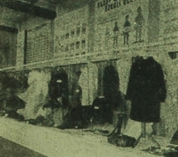
Dział uszno rozwiązują się z każdym rokiem to kra- wiecictwo, gra- nicarstwo, ka- leńnictwo i wiele innych branż.

W Izbie Rzemieślniczej czynna jest wystawa pod hasłem „Aktywniejszymi rzemieślnicami w eksporcie oraz w usługach i produkcji dla ludności”. Wystawa zorganizowana została przez białostocką Izbę Rzemieślniczą i Spółdzielczą Przedsiębiorstwa Techniczno-Handlowe „Remex” CZRSZTB, w Warszawie.