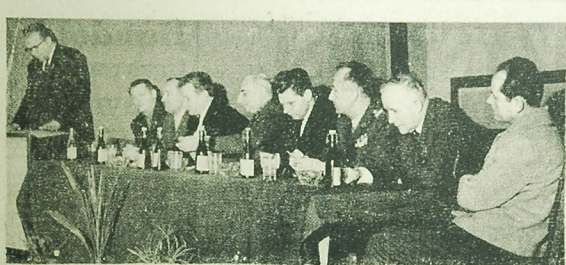
NA ZDJĘCIU: prezydium Plenum Zarządu Okręgu ZBoWiD.