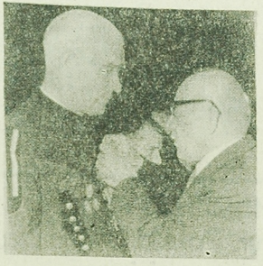
Podczas centralnej akademii barburowej w Zabrzu. Władysław Gomułka wczwst 23 osobom insygnia „Zasłużonego Górnika Polskiej Rzeczypospolitej Ludowej”.

W latach bieżących pięciolatki szybko tempo rozwoju wykazuje przemysł siarkowy. Kopalnictwo siarkowe jest w naszym kraju nową gałęzią górnictwa, rozuwne załogi siarki w rejonie Tarnobrzegu zostały