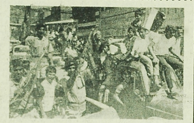
Jednostki brytyjskie przekazały 26 km. armii pld.-arabskiej danielce Krater w Adenie realizując program e-... NA ZDJĘCIU: ludność Adenu i żołnierze armii pld.-arabskiej manifestują swoją radość z powodu bliskiej już niepodległości.

znowu wzięli do przetrzymania powietrznej DRW, zrzucając bomby na różne obiekty, zarówno cywilne jak i wojskowe. Samoloty USA zaatakowały m. in. lotnisko Kien An odległe o 10 km od Hanoi. USA przygotowują nowe niebezpieczne plany przeciwko neutralnej Kambodży — pisał wietnamski „Przedw”. USA poszukują wyjścia z impasu brudnej wojny w Wietnamie na drodze dalszego rozszerzenia konfliktu, dążąc do przeniesienia zarzewia wojny na terytorium Kambodży i Laosu.