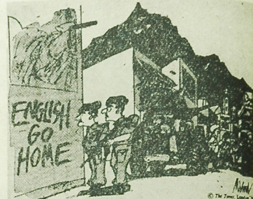
- Działaj Aden... a jutro może Szokcja, czy Wallia? - Działaj Aden... a jutro może Szokcja, czy Wallia? - The Times

O godz. 12.34 samolot specjalny wystartował z Okęcia, biorąc kurs na Sztokholm.