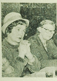
W pow. dąbrowskim wybory...