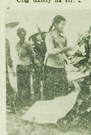
Mieszkańcy Hanoi oglądają szczątki kolejnego samolotu amerykańskiego, zestrzelonego nad stolicą DRW.

W dniu 18 listopada artyleria nadržana uszkodziła amerykański okręt wojenny, który wtrącił na wody terytorialne w prowincji Quang Binh. Jest to 61 z kolei jednostka USA trafiona pociskami artylerii DRW. W Wietnamie południowym walki amerykańskiej bazy Dak To w dalszym ciągu trwa ofensywa sił wyzwoleńców. We wtorek rano patrioti przypuścili nowy atak na pozycje amerykańskich szkiełców spado-