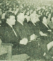
Uczestnicy sesji: pedagogy, zaproszeni goście, młodzież szkolna.