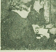
Wręczenie legitymacji nowo przyjętym członkom ZMS.