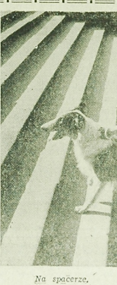
Na spacerze

Plan rozdziału mieszkań z bieżącymi piętłakami jest sporządzony. Tym niemniej do Wydziału Spraw Lokalowych Prezydium MRN wpływają nadal nowe wnioski o przydział mieszkań. Jest ich około 10 tysięcy. Jak załatwić się to wnioski? Osoby ubiegające się o mieszkanie informuje się przede wszystkim o możliwościach wstąpienia do spółdzielni mieszkaniowych. Komisja koordynacyjna do spraw rozdziału mieszkań przyznała chętnym pożyczki. W tym roku Białostok otrzymał na pożyczki na wkłady mieszkaniowe łączną sumę 3.913 tys. złotych, z czego 730 tys. złotych do umorzenia. Rozdzielono więc 3.111 tys. złotych. Skorzystało z nich 258 (CH)