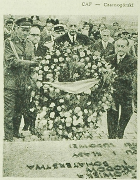
NA ZDJĘCIU: Oswiecim — prezydent Charles de Gaulle składa wieniec pod pomnikiem 4 milionów ofiar w Oświęcimiu. Ciąg dalszy na str. 2

Łącznie z Francji w okresie od marca 1942 r. do czerwca 1944 r. przywieziono ok. 80 tys. ofiar. Po zwiedzeniu oświęcim. Ciąg dalszy na str. 2