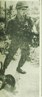
Do lotniska jeden dowódca amerykańskich, a prezydent do stożka do bezbronnej ludności cywilnej południowego Wietnamu. Zdjęcia powzięte przez żołnierzy amerykańskich na planie Wietnamu jako skutecznego podjęcia przetrwania na terenie rejonu Bong Son.

Generałowi de Gaulle przedstawiono historię zagłady Francuzów w Auschwitz-Birkenau, która najlepiej ilustruje znajdującą się w muzeum stań narodowa ekspozycja tego kraju.