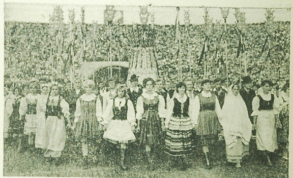
Fragment widowiska dożynkowego.