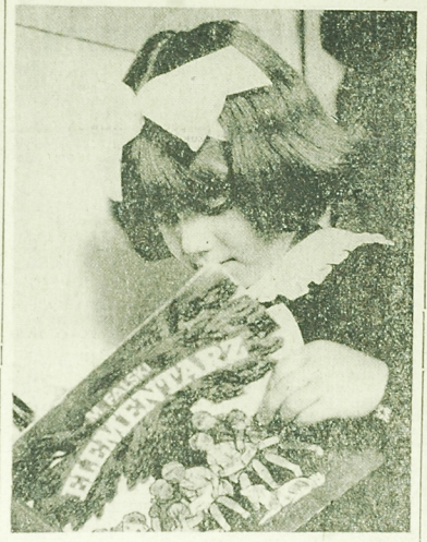
Dzień pierwszy dzień zajęć w nowym roku szkolnym. Młodzież udała się do szkół z torami i torami wypełnionymi książkami i zeszytami. Wiemy, że w szkole książkowa zostanie dobrze przynajmniej, a zeszyty wypełnione są ocenami dobrymi i b. dobrymi.

W obecności gości na akademii udekorowano najbardziej zasłużonych pracowników kołowskiimi odznaczeniami, przyznawanymi przez Radę Państwa. Order Sztandaru Pracy II klasy otrzymało 5 osób. Uczestnicy akademii wystąpili list z serdecznymi do-