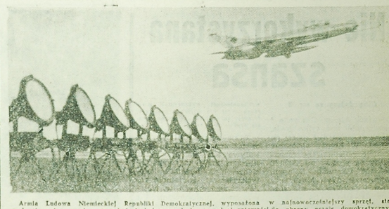
podosti pozlom svojego wysikolesia bojovego, bedąć w policej gotowościom ostona (fram. Kiemiec, Dokonaki system lączości i kostroli, w maczym stopoli zastowajyowany, rabezpiecza s połni przed zakoczeniem. NA ZDECIUS siatr posaddiwiękowego bombowca odzniewego podczas ćwiczeń Armii Ludowej.

Dyrektor pewnego przedce i w czekach, (7)