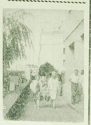
Bialystok - fragment ul. Malmeda