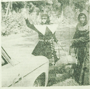
Sporób na „ewentual”. Pomysłownych „przebiegających” spotkaliśmy na trasie Mrągowo — Olsztyn.