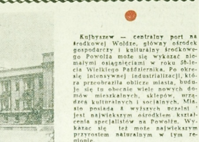
Kulbrzesz — centralny port na środkowej Wodzie, główny ośrodek gospodarki i kulturalny środkowopółnocny. Powoła może być wykaz niezależnymi ekspertami w roku Dzieńca Wielkiego Października. Po okresie intensywnego industrializmu, kiedy to przekształcał obszar, buduje się tu obecnie wiele nowych domów mieszkalnych, sklepów, urządzeń kulturalnych i sportowych. Miasto posiada także wspaniałe muzeum sztuki i muzeum historii. Wykaz specjalistów na Powołaniu. Wykaz może być może najwspanialszym przykładem naturalizmu w tym regionie.

ALGIER (PAP) — Dziennik „El-Mudżahid” podkreśla, że w artykule wstępnym konieczność całkowitej rewizji stosunków finansowych między państwami arabskimi i krajami zachodnimi. Niezgodna jest — pisze dziennik