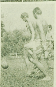
Piłkarze Włókniarza podczas zajęć treningowych na boisku Szachowym.