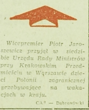
Wicepremier Piotr Jaroszewicz

MEXICO (PAP) — W niedzielę 13 lipca po południu trzęsienie ziemi w Wenezueli spowodowało śmierć kilkunastu osób. Trzęsienie ziemi w Wenezueli spowodowało śmierć kilkunastu osób.