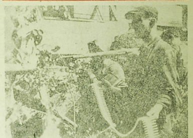
Stanowisko potężniejsze na Powisziu.

WARSAWA (PAP) — Z okazji 40 rocznicy powstania Chińskiej Armii Ludowo-Wyzwoleńczej, minister Obrony Narodowej Marian Spychalski wysłał depeszę gratulacyjną na ręce wicepreziera Rady Państwa i ministra Obrony Narodowej, Chińskiej Republiki Ludowej — Lin Piao.