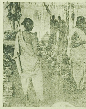
NA ZDJĘCIU: w różnych okrajach Indii ludność zbiera się na wspólne modły do bogów planety, w otwórci zbliżające się kłęk...

Przerzucając „rekordowy” jauhar odnotowany za panowania sultana Allau-d-Din, kiedy to popełniło samobójstwo 24 tysiące kobiet, od małych dzieci po sędziwe matro-