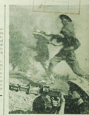
Zołnierze Wietnamskiej Armii Ludowej — gotowi do walki w obronie strefy łączymy przed amerykańskim agresorem. Pod tym hasłem w DRW prowadzone jest powszechne szkolenie wojskowe teoretyczne i praktyczne. NA ZDJĘCIU: Awiacja pilotów jednej z kompanii Wietnamskiej Armii Ludowej.

W czasie rozmowy przewodniczący Rumunii wyrażyła wdzięczność Komitetowi Nauki i Techniki i Krajowej Radzie Badań Naukowych Rumunii, stwierdzając celowość ustanowienia trwałych kontaktów między obu organami.