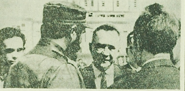
26 bm. przybył do Hawany premier Związku Radzieckiego. NA ZDJĘCIU: premier A. Kosygin (o środku) w towarzystwie na lotnisku w Hawanie premiera Kuby F. Castro (drugi z lewej).