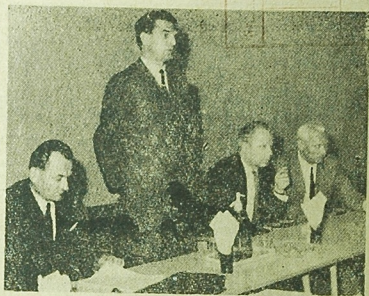
WARSZAWA (PAP) — W Warszawie VIII plenarne posiedzenie Komitetu Centralnego PZPR z następującym porządkiem dziennym: 1) o aktualnych zadaniach w pracy politycznej partii, 2) informacja o układach międzypartyjnych zawartych przez Polskę z Czechosłowacją, NRD i Bułgarią oraz z konferencji w Karlsruhe, 3) o aktualnych zadaniach w pracy politycznej partii, 4) o aktualnych zadaniach w pracy politycznej partii, 5) o aktualnych zadaniach w pracy politycznej partii.

WARSZAWA (PAP) — Komitet Centralny PZPR przesłał depesze z pozdrowieniami do XXI Zjazdu Komunistycznej Partii Szwecji, który rozpoczął swe obrady 13 bm, w Sztokholmie.