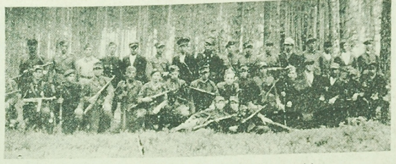
Jeden z oddziałów GL działających na Lubelszczyźnie.

Przed krakowskim Sądem Wojewódzkim na sejś wyjazdowej w Rzeszowie zakończył się proces przeciwko Krzysztofowi Piórkowskiemu oskarżonemu o morderstwo w diecie WSiNS, modyfikacji do końca roku 1979, a wykształcenie 80 inżynierów, a potrzebujemy 80 inżynierów wypuszczając co najmniej 80 inżynierów mechanizatorów rolniczych.