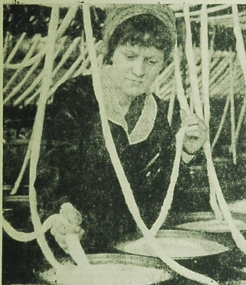
W Zakładach Przemysłu Bawełnianego im. Marchlewskiego w Łodzi. W wszystkich wymienionych lokalach jest 1982 miejsce konsumpcyjne.

akcji „białych niedzieli” sprawował lekarze - specjalistów uczeni, członkowie kółka asystentów i studenci starszych lat. Badania młodzieży szkolnej polonajnej były z ogłoszaniem pogadanki mędrców dla mieszkanców woj. W najbliższych przyszłości - jak postulowano w czasie dyskusji na konferencji sprawozdawczej - skłaja „białych niedzieli” powinna przekształcić się w stałą opiekę nad badanymi dziećmi. (tb)