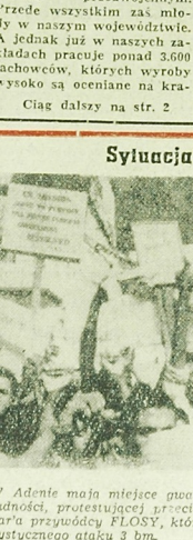
W Adenii mając miejsce gwałtowne demonstracje arabskiej ludności, protestującej przeciwko śmierci Hajdarra Shahrara przywódcy FLOSY, który zabity został podczas terrorystycznego ataku 3 m.