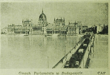
Gmach Parlamentu w Budapeszcie.