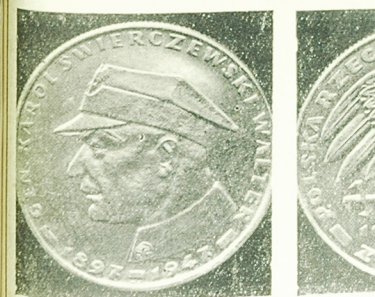
NA ZDJĘCIU: awers monety. W tła obrotu monety 10-złotowa w tła rewersu monety 10-złotowa...