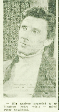
Wieloletni aktor teatralny i filmowy, aktor i reżyser...