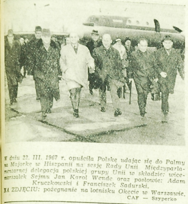
W dniu 23. III 1967 r. opuściła Polskę udając się do Palmy w Marokko...

Realizując zobowiązania 2 mln sztuk cegły wytworzą dodatkowo Zakłady Silikatowe