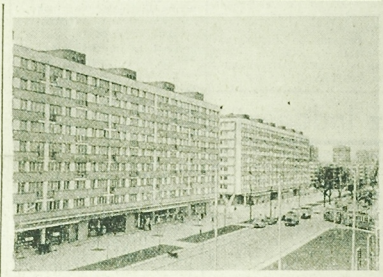
Nowoczesne budownictwo w Alei Wyzwolenia w Szczecinie.

nie pracy z młodzieżą nasze województwo przoduje w skali krajowej. Dyskusja wykazała, że Ochotnicze Hufce Pracy mają duże perspektywy w naszym województwie i powinny otrzymać pomoc ze strony wszystkich zainteresowanych. (su)