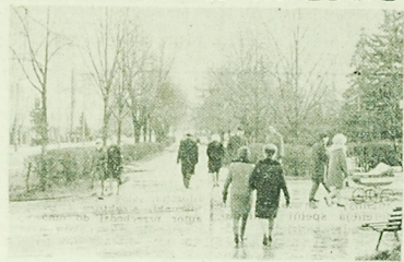
Jedna z alejek parkingowych przy ul. Mickiewicza.