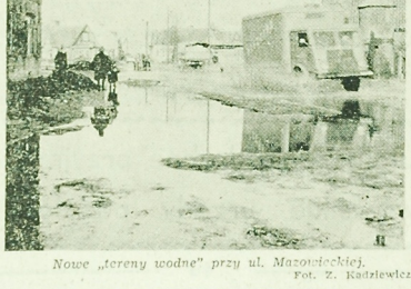
Nowe „Iron Maiden” przy ul. Mazowieckiej.

Kierownictwo Dzielnicowego Domu Kultury na Nowym Mieście inicjuje cykl spotkań z rzeczoznawcami sprzętu gospodarstwa domowego. Spotkania pod hasłem „Z technika na ty” ilustrowane będą pokazem prawidłowej i nieprawidłowej obsługi urządzeń. W tym celu w dniach 28 lutego i 5 marca odbyły się w świetlicy DDK. Uczestniczył w nim przedstawiciel „Argodu” i „Eldomu” (dal)